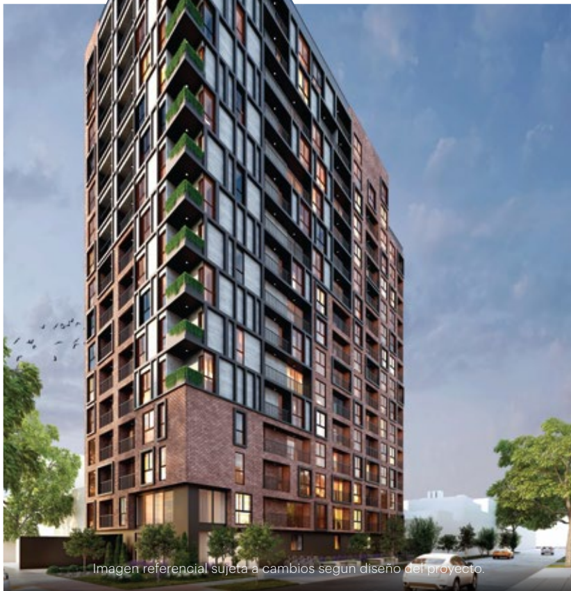
Imagen referencial sujeta a cambios según diseño del proyecto.